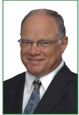
Claude Rousseau Ex Député d'État